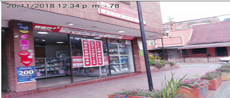
Fotografía panorámica del establecimiento de comercio RED CELULAR TEC, donde se evidencia los incumplimientos anteriormente descritos.