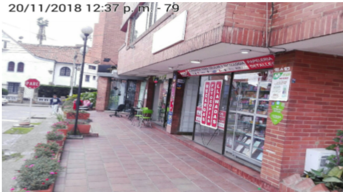
Fotografía panorámica del establecimiento de comercio RED CELULAR TEC, donde se evidencia los incumplimientos anteriormente descritos.